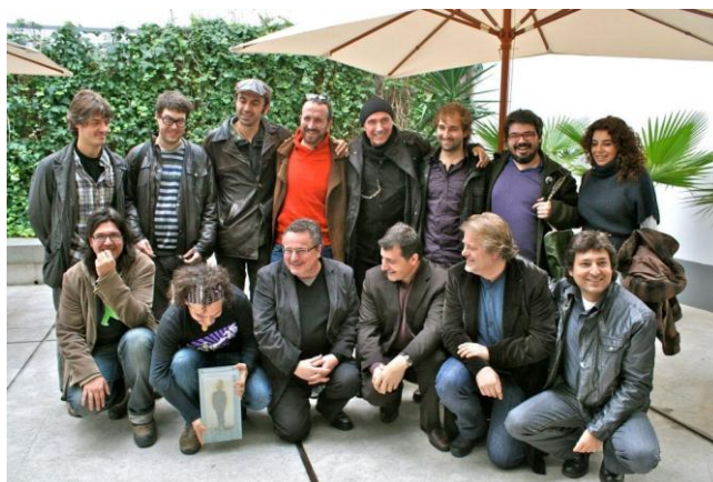
Finalistes i membres del jurat del Premi Miquel Martí i Pol 2011 Seu de la SGAE, Barcelona, 29 de novembre de 2011

Finalista del Premi Miquel Martí i Pol del Certamen Terra i Cultura 2011, amb la cançó Teoria de l'absència del disc Nura .