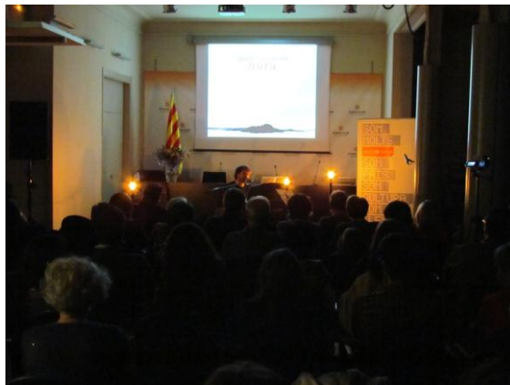
Acte de presentació i entrevista a la seu d'Òmnium, el passat 30 de novembre de 2011

http://www.elpuntavui.cat/noticia/article/5-cultura/19-cultura/483984-quan-la-creacio-es-sincera-no-es-deixa-manipular.html