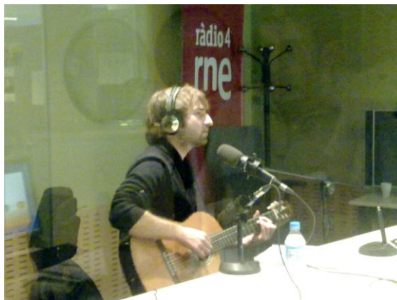
RNE4, el 30 de novembre 2011